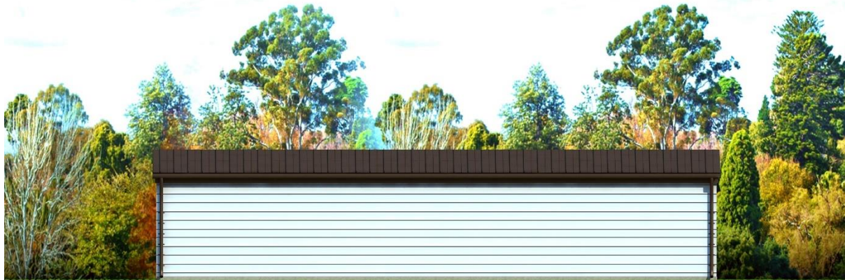
Elewacja – Tylna