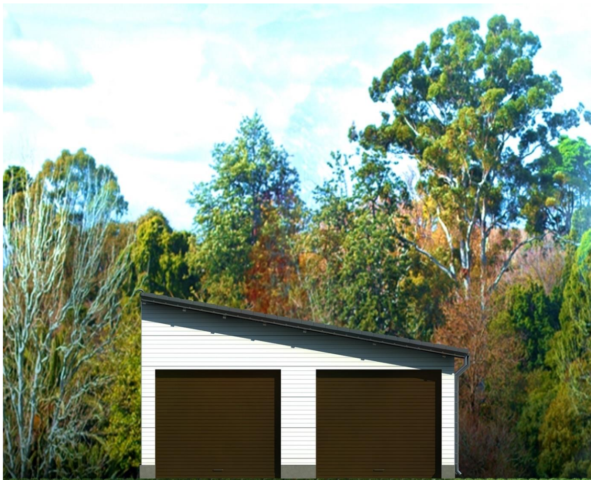
Elewacja – Boczna